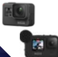
Image jusqu'à 5,3K60i - Etanche jusqu'à 10m de profondeur - Carte micro SD / Sortie micro HDMI - Kit d'accessoires