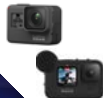
Image jusqu'à 5,3K60i - Etanche jusqu'à 10m de profondeur - Carte micro SD / Sortie micro HDMI - Kit d'accessoires